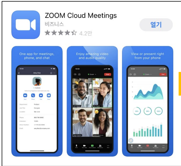
어플 다운로드 후 실행