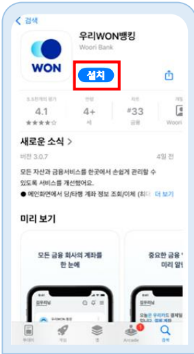
우리WON뱅크 앱 설치