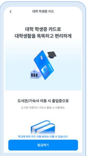
대학 학생증 카드메뉴