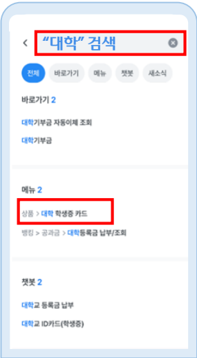
'대학 학생증 카드' 클릭