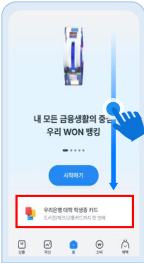
아래로 스크롤 '대학 학생증 카드' 클릭